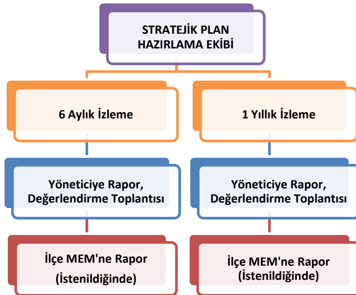
Şekil 2 İzleme ve Değerlendirme Süreci

Müdürlüğümüzün 2019-2023 Stratejik Planı İzleme ve Değerlendirme sürecini ifade eden İzleme ve Değerlendirme Modeli hazırlanmıştır. Okulumuzun Stratejik Plan İzleme-Değerlendirme çalışmaları eğitim-öğretim yılı çalışma takvimi de dikkate alınarak 6 aylık ve 1 yıllık sürelerde gerçekleştirilecektir. 6 aylık sürelerde Okul Müdürüne rapor hazırlanacak ve değerlendirme toplantısı düzenlenecektir. İzleme-değerlendirme raporu, istenildiğinde İlçe Milli Eğitim Müdürlüğüne gönderilecektir.